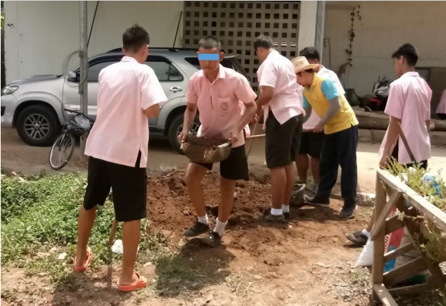
ภาพที่ 50 การให้นักเรียนรู้จักการทำงานร่วมกัน นอกจากจะเป็นการพัฒนาทักษะการทำงานแล้วยังเป็นการช่วยพัฒนาทักษะในการคบเพื่อนและมีลักษณะนิสัยรักการทำงานให้เกิดขึ้นในตัวนักเรียน เพื่อเตรียมความพร้อมสู่การทำงานเพื่อจบการศึกษา