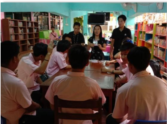
ภาพที่ 56 ครูผู้สอนงาน (Job Coach) สร้างความเข้าใจกับนักเรียนที่มีความบกพร่องทางสติปัญญาในระดับชั้นมัธยม ศึกษาตอนปลาย ก่อนการออกฝึกการทำงานในสถานประกอบการ

ข้อต่าง ๆ ที่ครูผู้สอนงาน (Job Coach) นำเสนอ ควรจัดเป็นเอกสารที่ผู้ประกอบการเข้าใจได้ง่ายและเป็นต้นแบบการปฏิบัติในการจ้างงานนักเรียนพิการได้ และเมื่อมีความจำเป็นครูผู้สอนงาน (Job Coach) ก็ควรปฏิเสธการจัดการของผู้ประกอบการ เพื่อปกป้องผลประโยชน์ของนักเรียนพิการ เมื่อเห็นว่าการจัดการนั้นทำให้นักเรียนพิการเสียประโยชน์มากกว่าได้