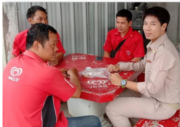
ภาพที่ 57 ครูผู้สอนงาน (Job Coach) สร้างความเข้าใจกับผู้ประกอบการ และเพื่อนร่วมงานของนักเรียนบกพร่องทางสติปัญญา เกี่ยวกับแนวทางการปฏิบัติในการฝึกการทำงานในสถานประกอบการของนักเรียน