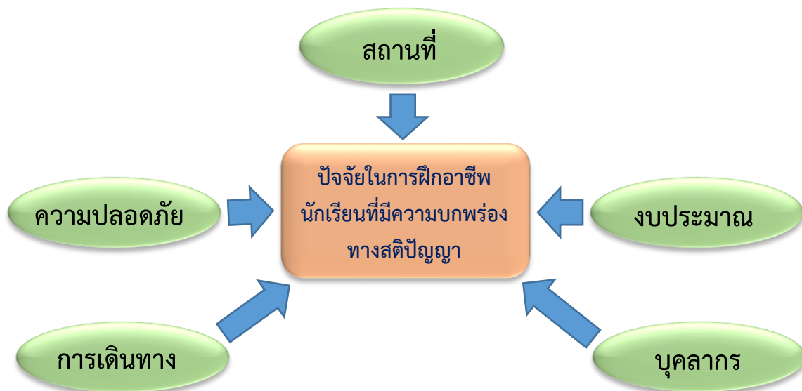
ภาพที่ 58 ปัจจัยที่ส่งผลให้การฝึกงานอาชีพของนักเรียนที่มีความบกพร่องทางสติปัญญาประสบความสำเร็จ

จึงพอสรุปได้ว่า ในการสอนหรือฝึกทักษะการทำงานในสถานที่จริงให้กับนักเรียนที่มีความบกพร่องทางสติปัญญานั้น มีสิ่งที่จะต้องคำนึงถึงเพื่อให้กระบวนการในการฝึกงานของนักเรียนประสบความสำเร็จ คือ สถานที่ในการสอน งบประมาณสนับสนุน บุคลากร การเดินทาง และการประกันความปลอดภัย ซึ่งถือเป็นหน้าที่ของทางโรงเรียนที่จะต้องมอบหมายหรือแต่งตั้งครูผู้ฝึกหรือบุคลากรรับผิดชอบในด้านต่าง ๆ เหล่านี้โดยเฉพาะ เพื่อให้การสอนทักษะอาชีพหรือการสอนงานของนักเรียนที่มีความบกพร่องทางสติปัญญาดำเนินไปสู่ความสำเร็จตามเป้าหมายได้อย่างมีประสิทธิภาพ